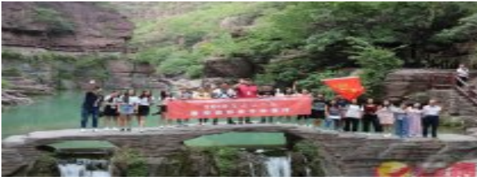
2019范長江行動中原行 雲台山的日與夜