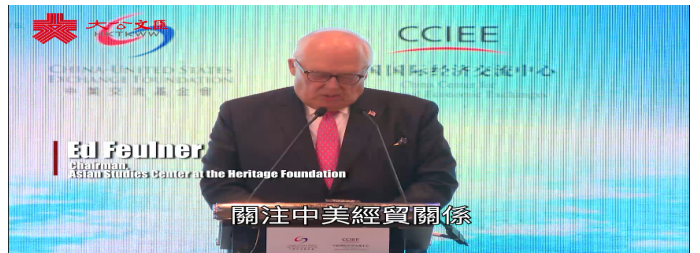
中美經貿關係論壇 | 美國傳統基金會創辦人：期待中...