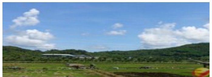
三亞水稻公園農旅融合促發展