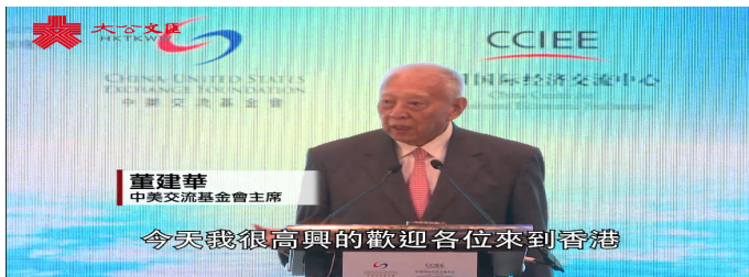
中美經貿關係論壇 | 董建華：目前是探討中美關係發...