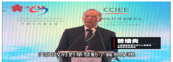
中美經貿關係論壇 | 曾培炎：中美貿易促經濟發展兩...