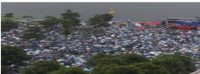
撐警集會金鐘舉行 大批市民為警隊「打氣」